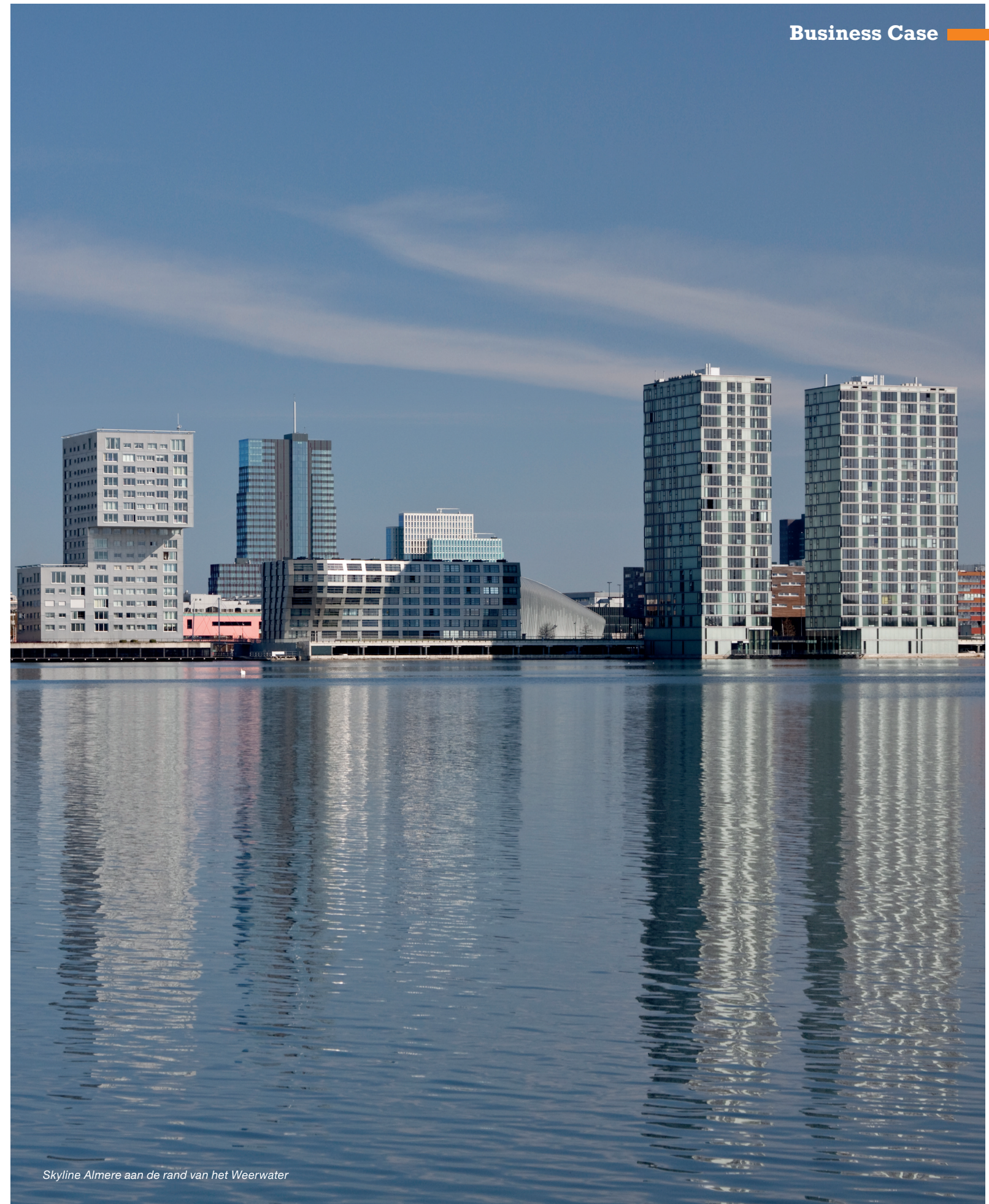
Skyline Almere aan de rand van het Weerwater