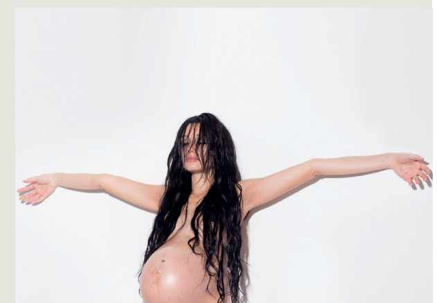
Toneelgroep Oostpool - De Rattenvanger